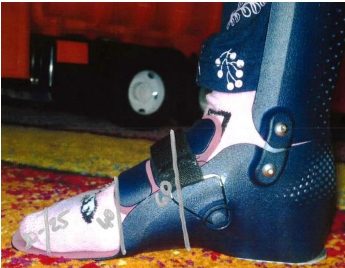
Vyznačení místa, kde bylo měřeno + záznam údajů o naměřené výšce/šířce.